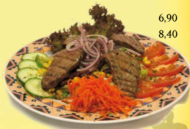
„South of the Border“ Salad