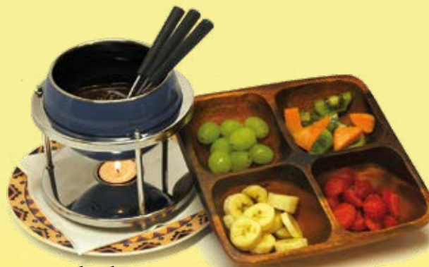
Chocolate & Fruits