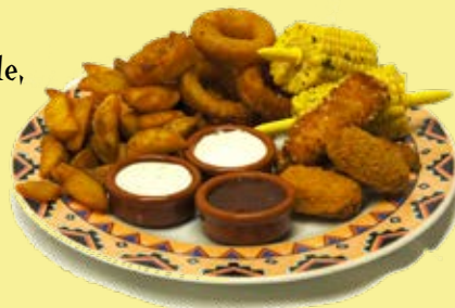
Mexicana`s Starter für 2 Personen